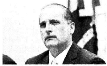
Onyx defendeu ampliação do número de itens nas lojas free shops.

O principal estado interessado é o Rio Grande do Sul, onde se há free shops terrestres funcionando em três cidades.